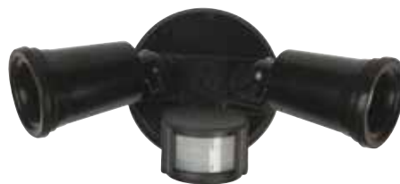
Buitemuurse PAR38 sensor-kollig

Jy kan ook hierdie nuttige buiteligte by jou naaste Cashbuild-winkel kry: