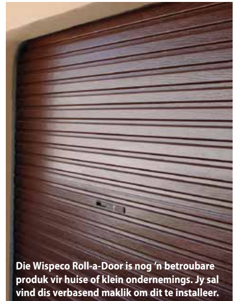
Die Wispeco Roll-a-Door is nog 'n betroubare produk vir huise of klein ondernemings. Jy sal vind dis verbasend maklik om dit te installeer.

Cashbuild dek al jou sekuriteitsbenodigdhede met stewige sekuriteitshekke, roldeure, sterk hangslotte en sensor-, kol en spreiligte wat skurke sal uithou. □