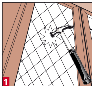
1 Slaan ruit versigtig uit.

Besoek jou naaste Cashbuild-winkel vir raad oor huisverbetering en herstelwerk. □