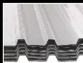
IBR- ("inverted box rib") plate.