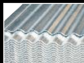
Sinkplaat bly 'n staatmaker.